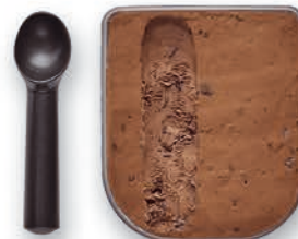
PINK ALBATROSS DOUBLE CHOCOLATE CHIP - CUBETA 2,2 LT.