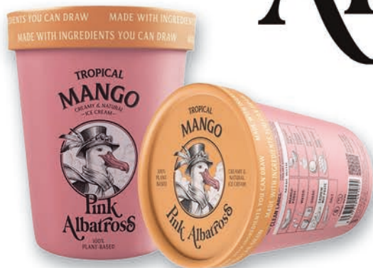
PINK ALBATROSS TROPICAL MANGO 480 ML.