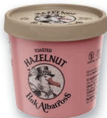
PINK ALBATROSS TOASTED HAZELNUT 90 ML.